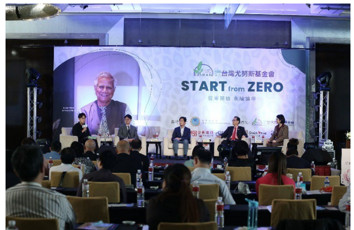
第二屆得獎者擔任本會 7 週年慶論壇分享者